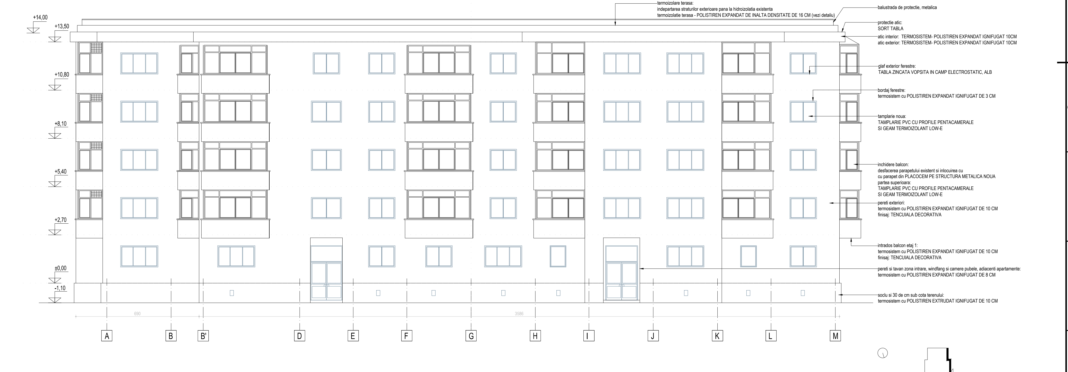
FATADA VEST PROPUNERE