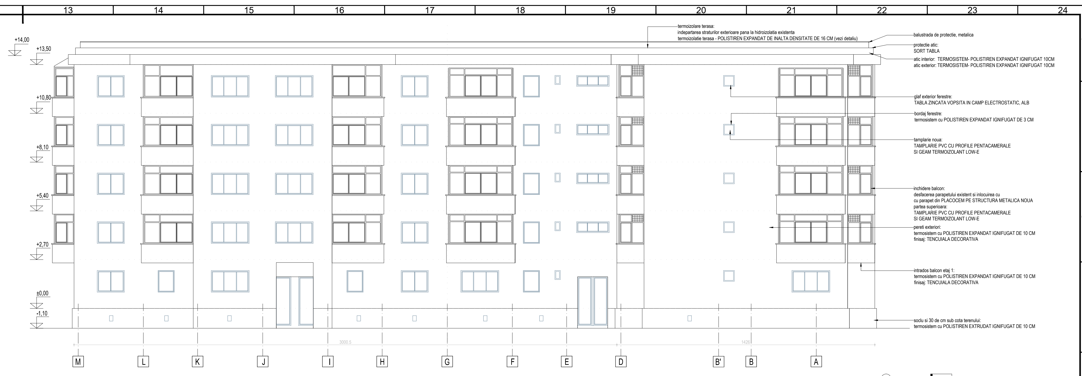
FATADA EST PROPUNERE